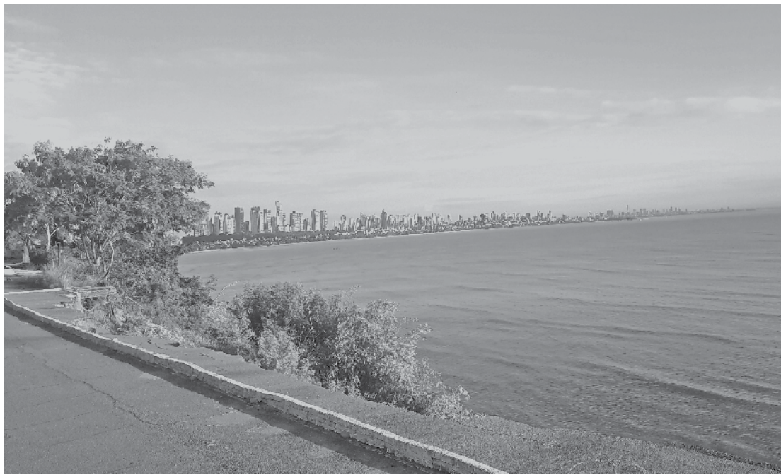
Ao fundo, mar e cidade!