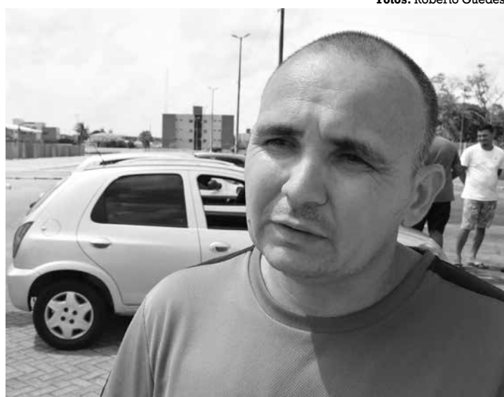
Categoria aderiu ao movimento nacional em busca de melhorias