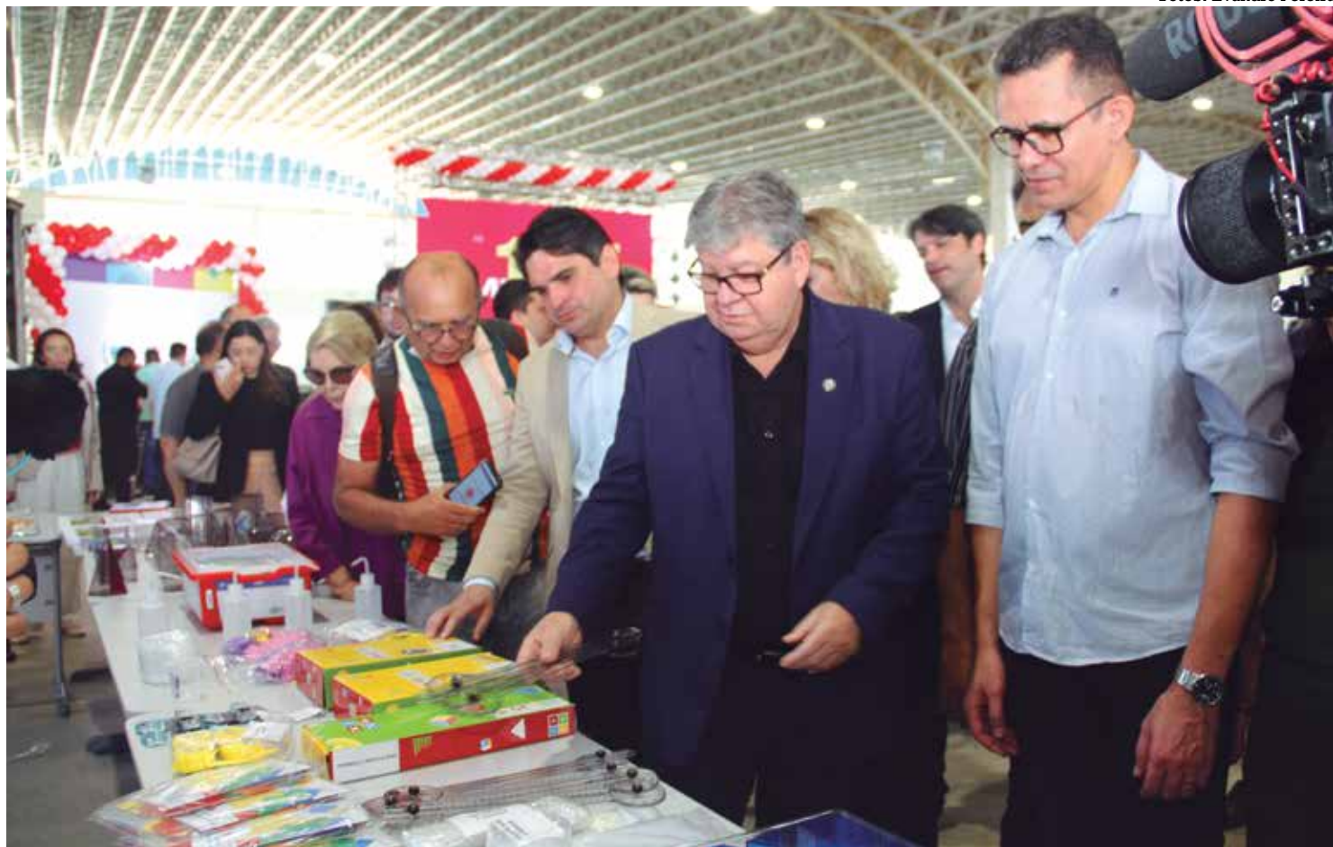
Governador João Azevêdo entregou material que vai beneficiar as escolas das 14 Gerências Regionais de Ensino da Paraíba

"Acredito que o melhor caminho para selecionar servidores é através do concurso público, porque até porque o próprio processo seletivo classifica aqueles que se dedicaram mais aos estudos e tem um maior nível de conhecimento", finalizou João Azevêdo.