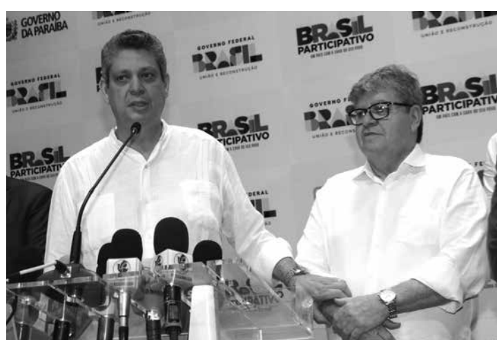
Ministro chefe da Secretaria-Geral da Presidência da República, Márcio Macêdo, e João Azevêdo durante cerimônia no Espaço Cultural