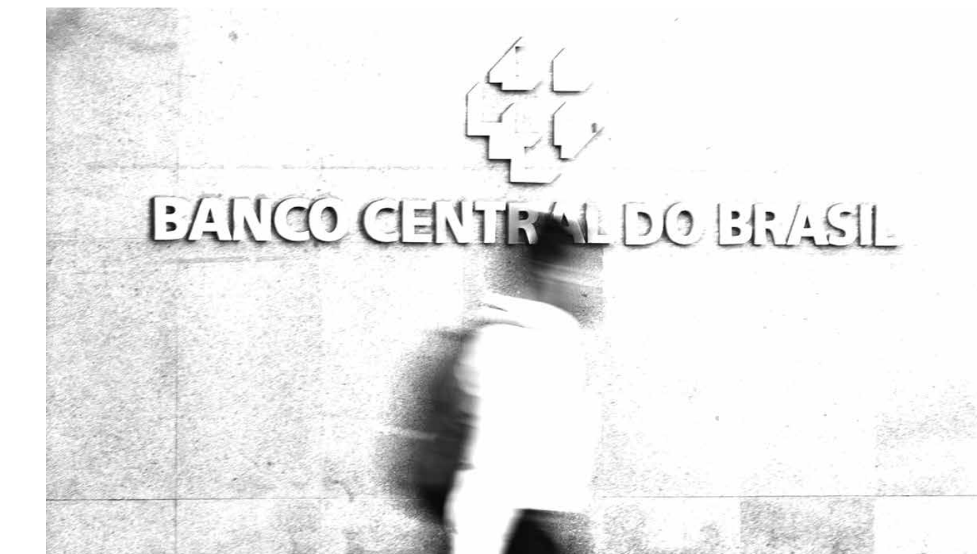
Para alcançar a meta de inflação, o Banco Central usa como principal instrumento a taxa básica de juros, a Selic

Para alcançar a meta de inflação, o Banco Central usa como principal instrumento a taxa básica de juros, a Selic, definida em 13,75% ao ano pelo Comitê de Política Monetária (Copom). A taxa está nesse nível desde agosto do ano passado, e é o maior desde janeiro de 2017, quando também estava nesse patamar.