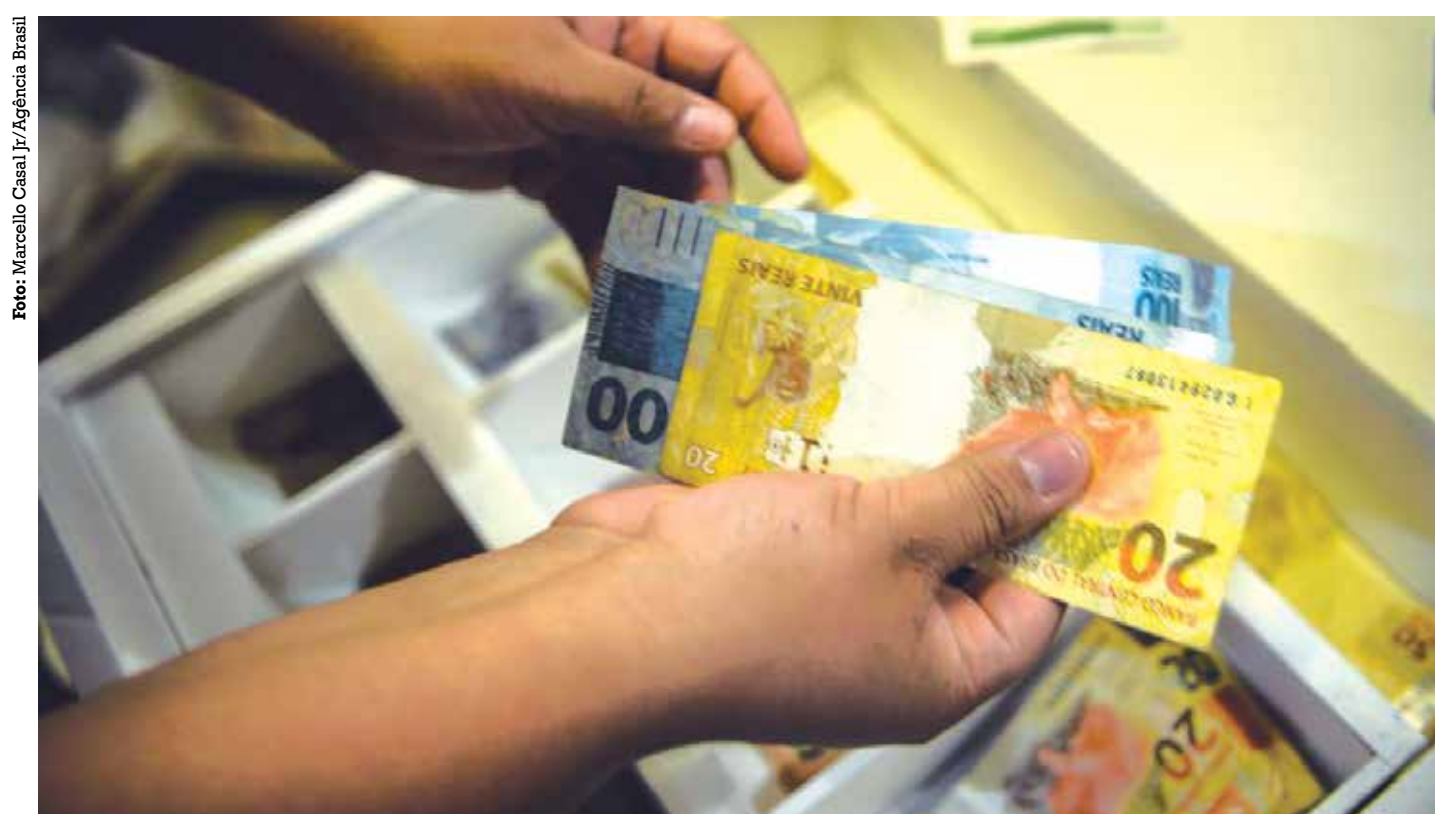
O valor do abono salarial para cada trabalhador varia de R$ 110 até o valor de um salário mínimo (R$ 1.320)

O pagamento para dois novos grupos começou ontem e segue até 28 de dezembro. De acordo com o MTE, a Caixa Econômica Federal está pagando a 54.575 traba-