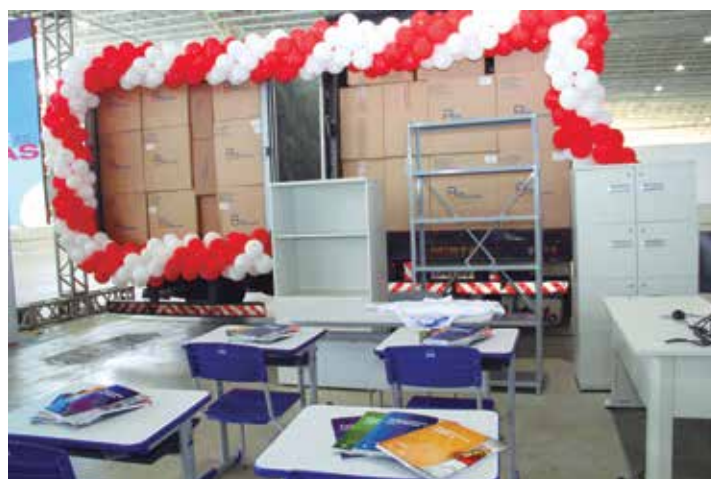
Mais de 500 unidades de ensino irão receber os equipamentos