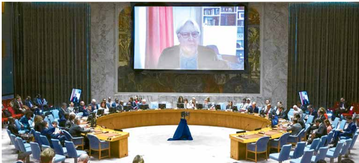
O Conselho de Segurança das Nações Unidas voltou a se reunir, ontem, para discutir a situação de ajuda humanitária na Ucrânia

Ele agradeceu a “bravura” dos trabalhadores humanitários, em especial os ucranianos. Por outro lado, ele ressaltou que o maior desafio é acessar áreas sob controle militar da Rússia.