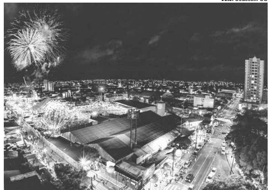
Cidade se prepara para início dos festejos, previsto para o dia 1º de junho até 2 de julho