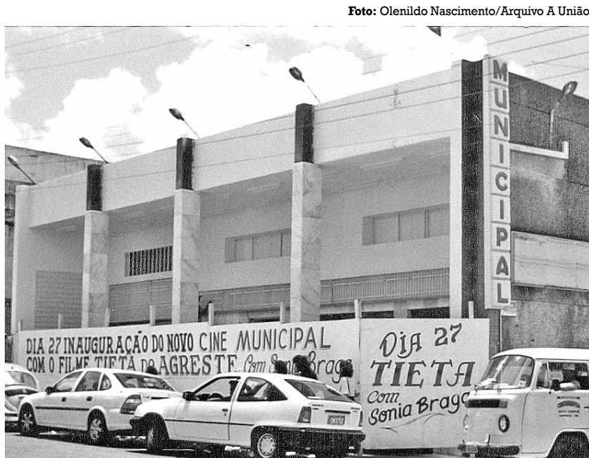
Em 1996, reforma do Cine Municipal, localizado no Centro da capital paraibana