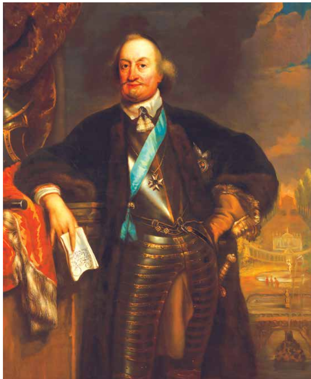
Maurício de Nassau será o assunto do simpósio, amanhã, com a arquitetura e paisagismo no Recife

De acordo com o grupo de pesquisa, assim como Olinda (PE), o município de Mamanguape também foi incendiado pelos holandeses quando ainda era vila e que, sobretudo, por ser omitida pela historiografia oficial, essa é outra parte da nossa história que merece ser resgatada e debatida.