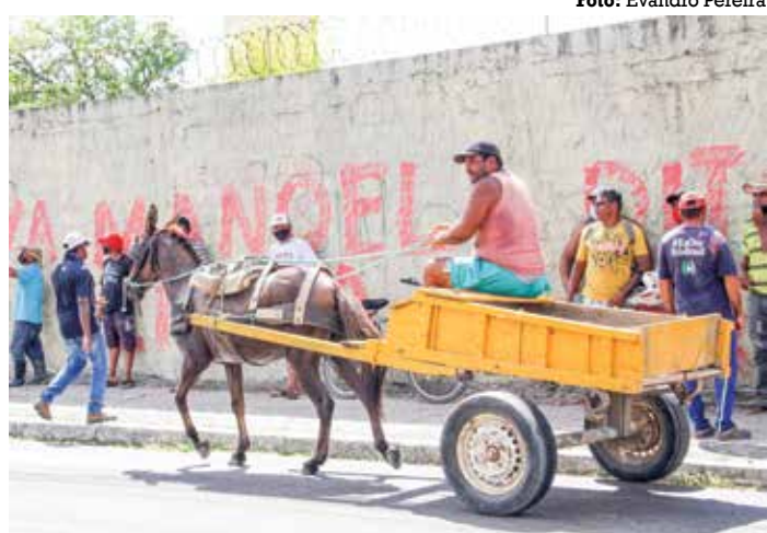
Carroças podem circular em ruas sem grande fluxo de veículos