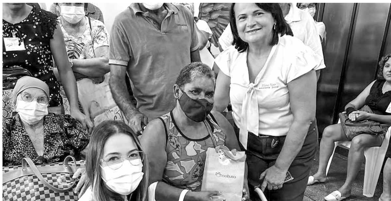
Paciente em tratamento oncológico foi homenageada durante a comemoração do Dia das Mães

O momento, teve distribuição de brindes, sessão de maquiagem, música com voz e violão e café da manhã especial