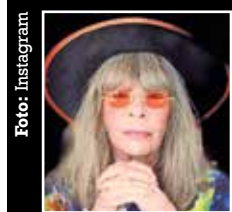
Rita Lee, sugerindo seu epítáfio

“Ela nunca foi um bom exemplo, mas era gente boa.”