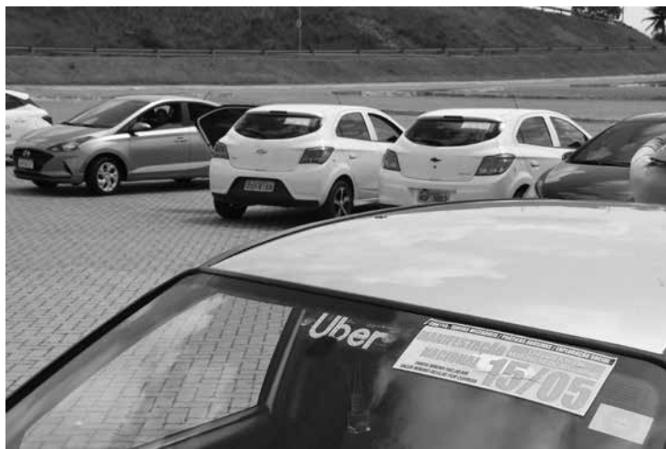
Empresas ainda não se posicionaram sobre as paralisações