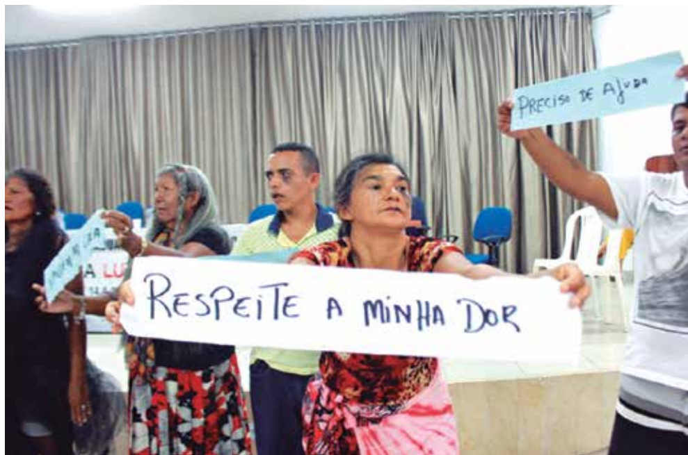
Programação alerta para a necessidade de uma sociedade sem manicômios e com mais inclusão

■ Familiares e usuários dos serviços de saúde mental saem às ruas por uma sociedade sem manicômios